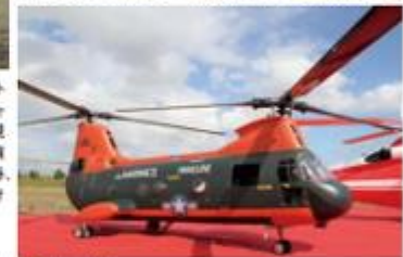
↑タンデムヘリはHIROBOチヌーク。