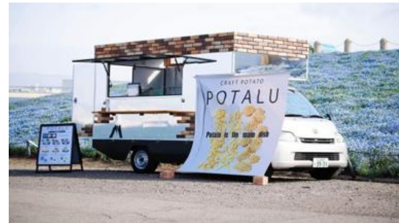
キッチンカーによる飲食店も完備