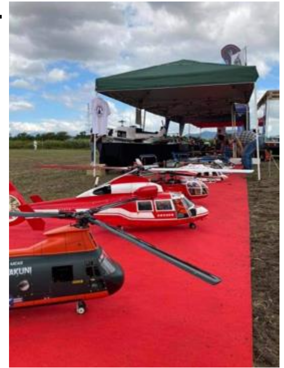
スケールヘリ展示