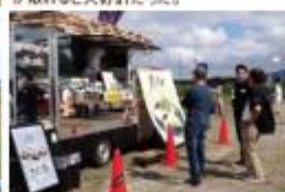
↑会場には協賛メーカーもブースを出展、製品展示や設定調整会なども行った。