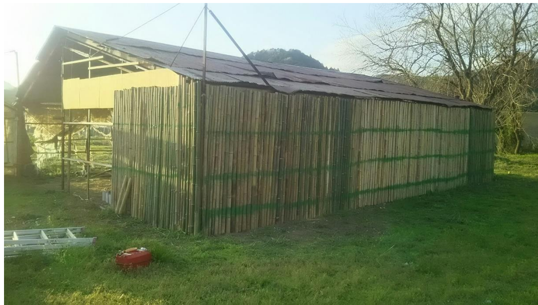
全周が竹で覆われました