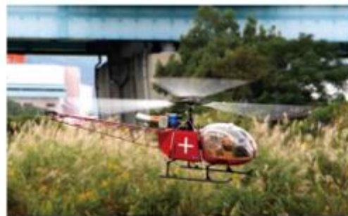
↑迫力のスケールフライトを見せるHIROBOの電動BIG LAMA。