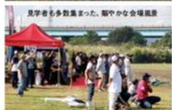
見学者も多数集まった、賑やかな会場風景