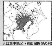
人口集中地区（首都圏近郊の例）

https://www.mlit.go.jp/koku/koku_fr10_000041.html https://www.mlit.go.jp/en/koku/uas.html